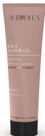
PHOTO DU PRODUIT

Chogan Group SpA www.chogangroupspa.com support@chogangroup.com